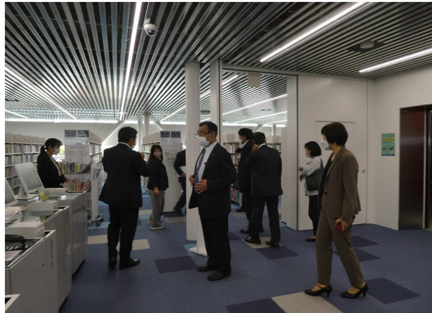
現地調査 (リブリオ行橋)