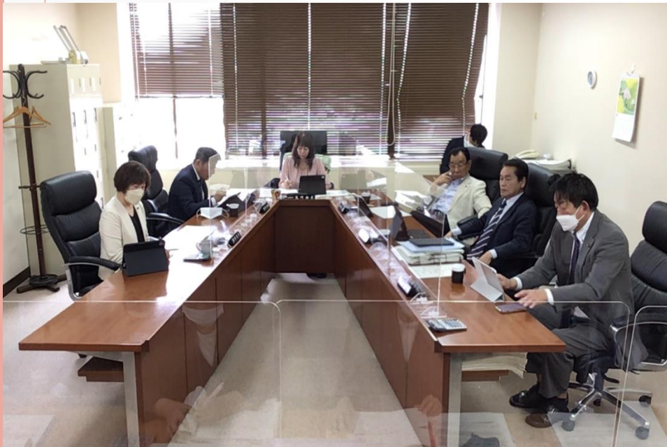
委員会室内の様子