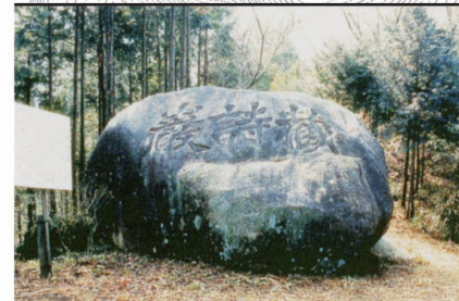
蔵詩巖 村上仏山の著作を納めた巨石