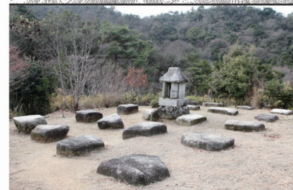
礎石建物跡 古代山城の建物跡と推定される