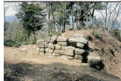
東門跡 片側の石垣が崩れた小型の城門