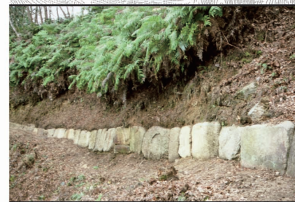
列石 土塁の基礎補強に並べられた石