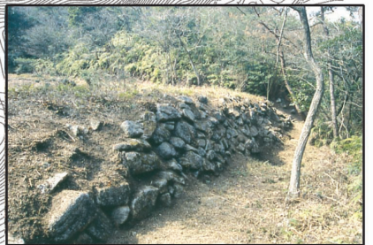
馬立場石塁 貯水池の堤と推定される遺構