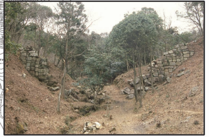
西門跡 中央部が崩れた大規模な城門