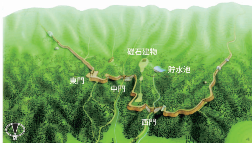
御所ヶ谷神籠石の推定復元図

各地の神籠石系山城のなかでも、御所ヶ谷神籠石は大規模な石塁や土塁に象徴されるように城としての完成度が高く、当時の中央政権が京都平野を北部九州の防衛の要として重視したことを示しています。