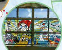
パブリックアート