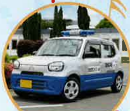
青色回転灯装備車

宝くじは、少子高齢化対策、災害対策、 公園整備、教育及び社会福祉施設の 建設改修などに使われています。