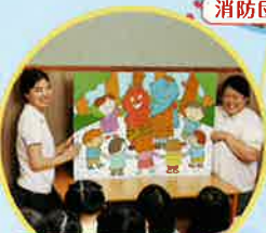
宝くじドリームジャンボ絵本