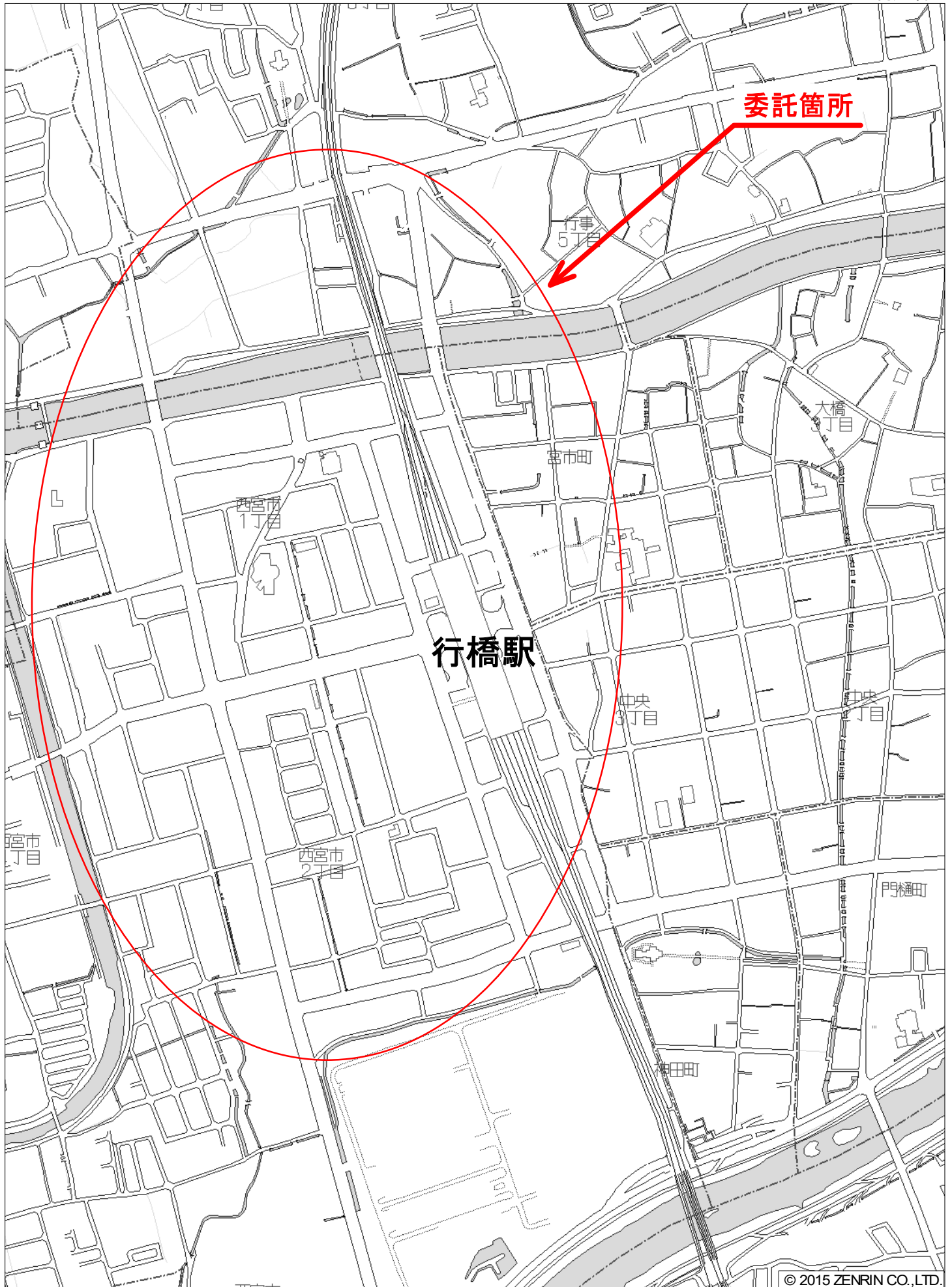
行橋市西宮市2丁目付近