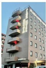
プラザホテル直方 ペア宿泊券