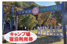
キャンプ場宿泊利用券