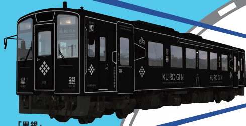
「黒銀」 3月20日運行開始