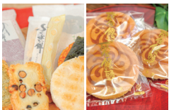
直方市特産品 詰め合わせ(もち吉・成金饅頭)