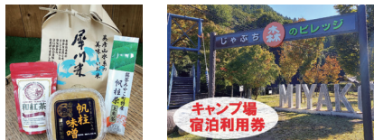
特産品 詰め合わせ