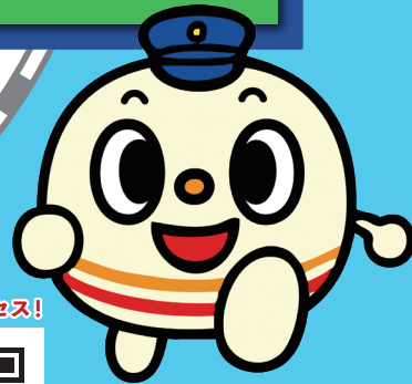
へいちくキャラクター 「ちくまる」