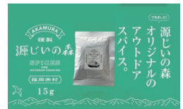
源じいの森 オリジナルの アウトドア スパイス