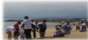
今元小中学校合同の長井の浜清掃活動