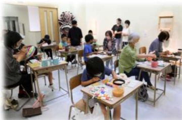
美術館でのワークショップ