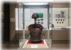
歴史資料館での体験教室

特別展・企画展のほかに、歴史教室や子どもたちが参加できる体験教室も開催しています。