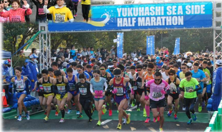
ゆくはしシーサイドハーフマラソン