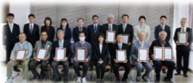
指定書交付式（令和4年4月）

令和4年4月から市内小中学校の全校にて開始。地域との連携を進め、地域とともにある学校を目指します。