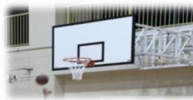
今元中学校バスケットゴール設置工事完了 (令和4年度)