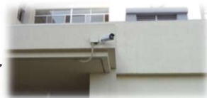
小中学校防犯カメラ設置事業完了 (令和4年度)