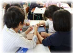
タブレット端末を活用したグループ学習