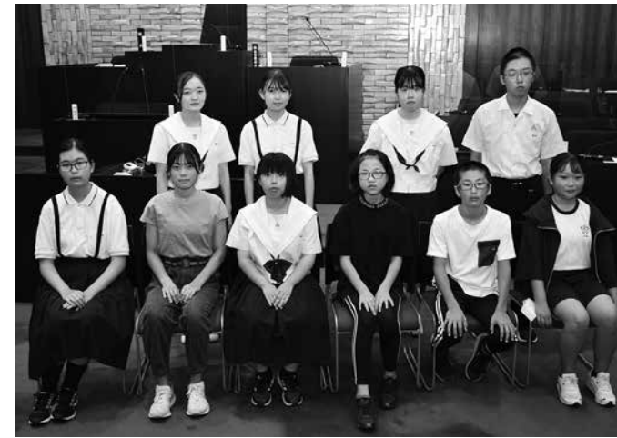
午前中に質問を行った子ども議員の皆さん