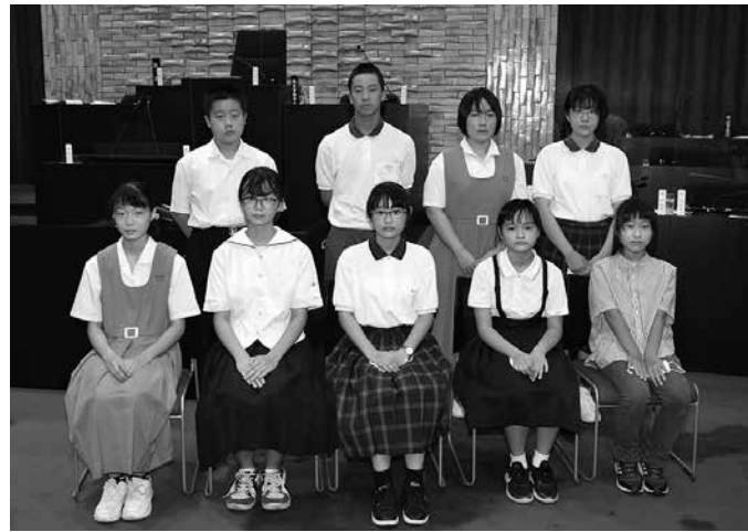
午後から質問を行った子ども議員の皆さん