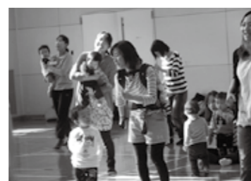
子どもといっしょに エアロビクス♪