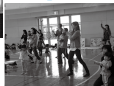
ママのほうが 真剣みたい～