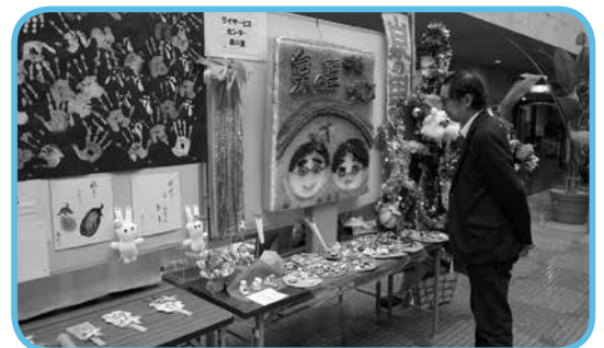
介護サービスの利用者が自宅や通所介護事業所で制作した作品を展示する、いきいき作品展がコスメイト行橋で開催されました。