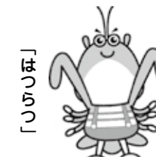
●ゆくはし健幸キャラクター●