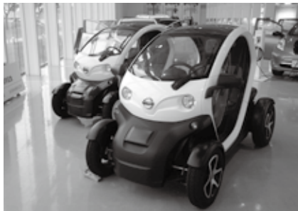
日産ニューモビリティコンセプト