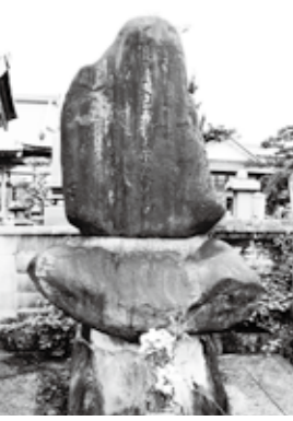
今井・西福寺の「後藤又兵衛基次電塔」

【日時】①8月7日（日）②12月11日（日）いずれも13時30分～16時30分 【行程】市歴史資料館で特別展を見学後、バスで移動。守田蓑洲旧居→沓尾石切丁場→香園寺→西福寺→浄喜寺等を巡回 【定員】各25人 ※保険料50円が必要です。 【申込み】参加者全員の氏名・連絡先・希望日を明記の上、往復ハガキで〒824-0005 行橋市中央一丁目9番3号 行橋市歴史資料館（TEL 25-3133）まで 日程①は8月1日（月）、②は12月5日（月）が期限です。