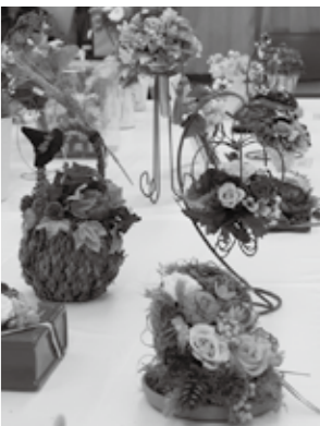
フラワーアレンジメント・陶芸展等もあります。

行橋市文化協会では、市民文化祭をよりよいものにするために、ご支援いただける賛助会員を募集しています(賛助会員 105000円から)。詳しくは、文化協会事務局へお問い合わせください。