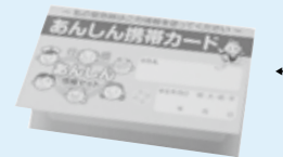
←あんしん情報カード

配布される専用容器の中には、あんしん情報シート、あんしん情報カード、掲示用ステッカー・マグネットなどが入っています。