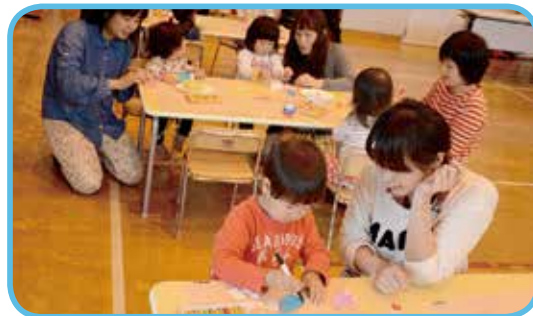
子どもの日を前にした 4 月 27 日、子育て支援センター主催の Sun ちゃん広場で 0 から 5 歳児を 対象としたこのほりづくりが行われました。