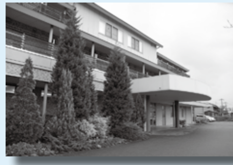
行橋市行事7-25-3 TEL 22-7727

「思い出がいっぱいの家、慣れ親しんだ地域で最期まで暮らしていきたい」。そんな思いに向き合い、寄り添い、安心して生活が送れるようにサポートしています。