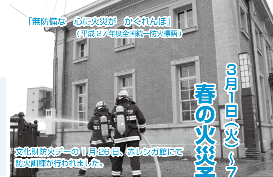
文化財防火デーの1月26日、赤レンガ館にて 防火訓練が行われました。

【お問合せ】 行橋市消防署 TEL 25-2323 皆さまのご理解とご協力をお願い します。