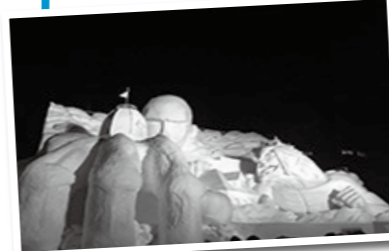
▲ 進撃の巨人の巨大彫刻

先日、私は雪祭りのために北海道に行きました。私が3年前、東京で交換留学をしていた時、初めて雪祭りのことを知りました。とても行きたかったのですが、