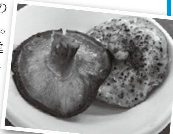
▲ バター味(左)とチーズ味(右)の焼きしいたけ

私が一番見たかったのは「進撃の巨人」「ドラゴンボール」「スノーピー」の雪像です。アニメが好きなので、好きなキャラクター達が画像から立体化して、目の前に立っているのを見られるだけでワクワクしました。