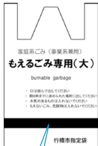
市指定ごみ袋の黒帯の箇所に、標語を掲載する予定です。