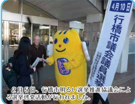
2 月 5 日、行橋市明るい選挙推進協議会による選挙啓発活動が行われました。

次号 (3 月 15 日号) の発行日は 3 月 15 日 (火) です。 ※相談日については、いずれも祝・休日を除きます。