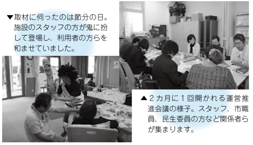
▼取材に伺ったのは節分の日。施設のスタッフの方が鬼に扮して登場し、利用者の方を和ませていました。

「思い出がいっぱいの家、慣れ親しんだ地域で最期まで暮らしていきたい」。そんな思いに向き合い、寄り添い、安心して生活が送れるようにサポートしています。