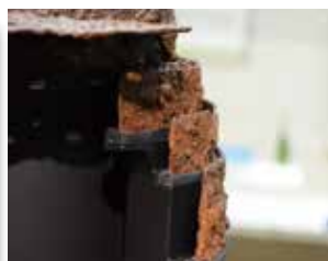
冑の頭頂部の装飾には金箔が施されています（左） 顔の側面から後頭部にかけて保護する鋳も立体的に復元（右）