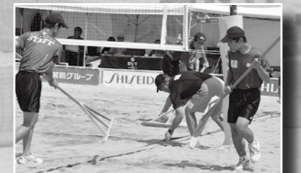
▲大会運営にご協力いただいた方々