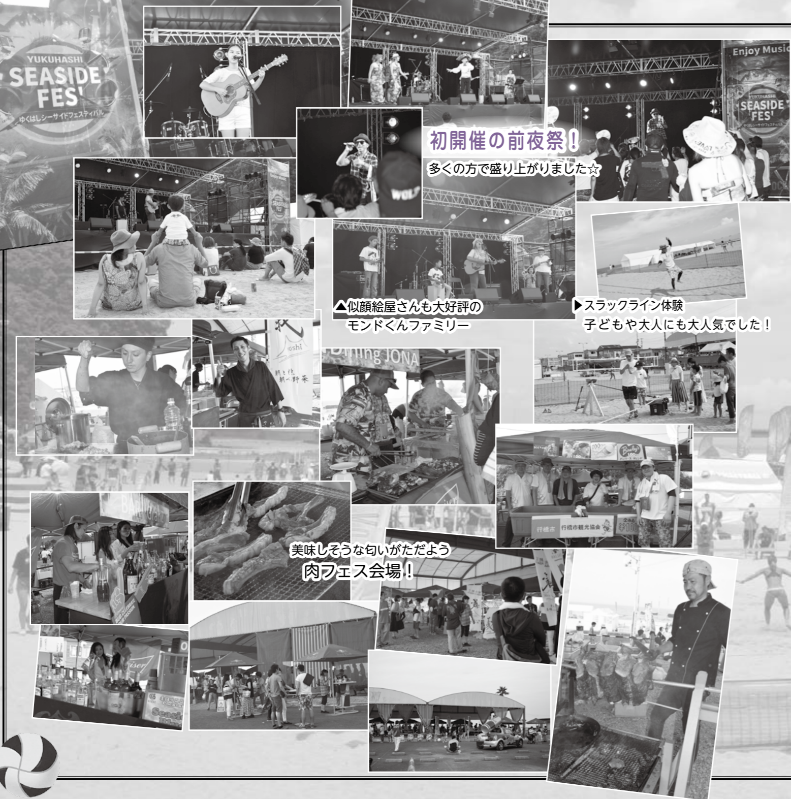
初開催の前夜祭！ 多くの方で盛り上がりました☆