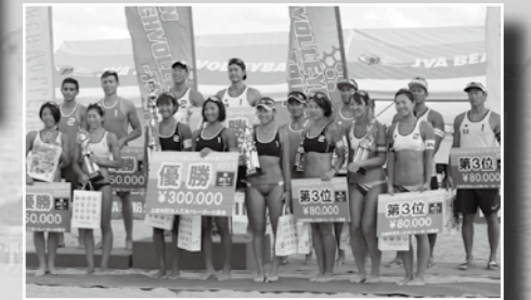
▲表彰式の様子。激戦を制した選手たち