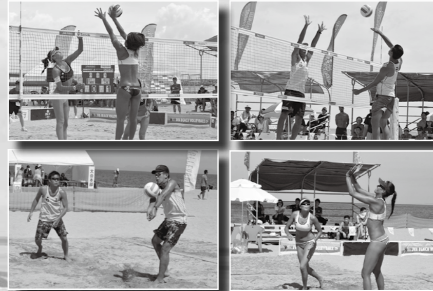
▲国内最高峰の競技大会「ジャパンビーチバレーボールツアー」。繰り広げられる熱戦に、観客からは熱い声援が送られました。

また、初開催となった15日の前夜祭「シーサイドフェスティバル&肉祭」にも多くの方にご来場いただきました。3日間の会場の様子をお届けします。