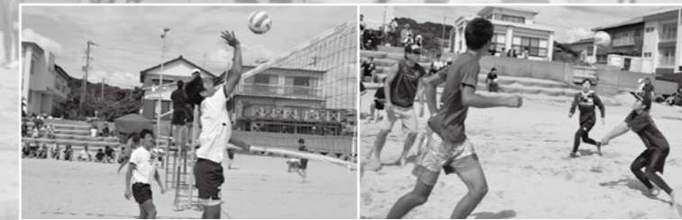
▲高校生大会（左）と長井浜カップ（右）の様子。一般の方にもご参加いただきました。