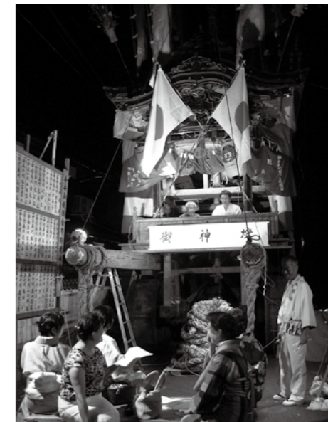
▲今井祇園行事 車上連歌の様子

行橋市では今井祇園行事【県指定無形民俗文化財】の中で室町時代から連歌が奉納されています。平成16年には国民文化祭「連歌大会」の会場となり、この翌年から毎年「行橋連歌大会」を開催してきました。