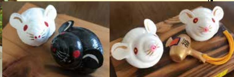
▲以前の「ねずみ年」のデザイン