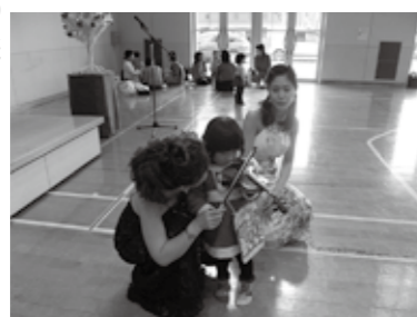
演奏会の後、本物の ヴァイオリンを さわらせてもらったよ!

11時から誕生会をします。誕生会が始まる前に手形・ 計測をします。誕生者の み市報掲載用の写真撮影 をします(希望者のみ)。