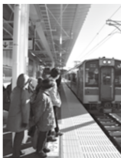
震災以来5年9カ月ぶりに運行再開したJR常磐線。

度は山下第二小学校の開校、JR常磐線の運転再開に伴う新山下駅と新坂元駅の開業という、復興事業としての核となる大規模なイベントがありました。また、新たな復興住宅が設立されることにより、数多くあった仮設住宅の集約も視野に入ってきました。