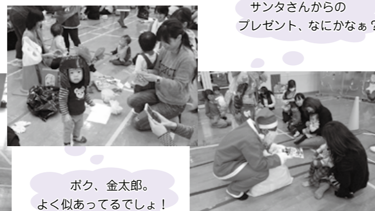
サンタさんからの プレゼント、なにかなあ?