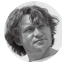
VIKTAR KOPACH (ベラルーシ)