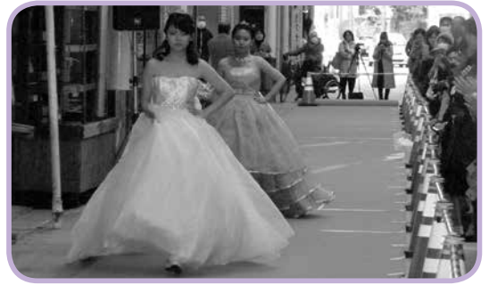
12月15日、えびす通り商店街で「えびす年金まつり」が開催され、行橋高校の生徒によるファッションショーが会場を盛り上げました。

窓辺から差し込む朝日が、人影のない廊下を真っ直ぐに照らしていき... 編集後記 12月15日、えびす通り商店街で「えびす年金まつり」が開催され、行橋高校の生徒によるファッションショーが会場を盛り上げました。