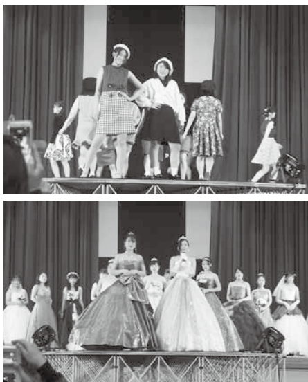
▲昨年度の産業祭での様子 (行橋高校生)

行 橋産業祭「愛らんどフェア」にて、昨年度より服飾産業活性化を目的としてファッションショーを行っています。今年度は一部で、昨年同様行橋高校生活デザイン科のみなさんが自分たちでデザイン・制作した衣装を着ての「行橋高校ファッションショー」を開催。2部では、市民参加型のファッションショーステージ「行橋コレクション」の2部構成で行います。それに伴い、「行橋コレクション」での衣装協賛店・ブランド協賛企業 (衣装等の貸与・贈与) を募集します。自店お勧めのファッションアイテムを協賛いただき、PRにつなげていただければと思います。※御社名をパネル掲示板およびステージのアナウンスにて紹介させていただきます。 ◇日時 11月10日(日) 11時~12時予定 ※産業祭は11月9日(土)・10日(日)の2日間 ◇場所 行橋総合公園内市民体育館 ◇申込み 上記へ来庁または電話にて。