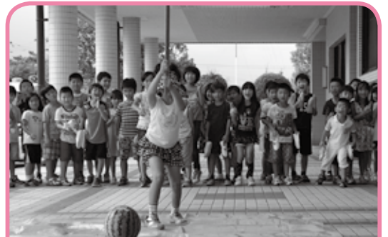
8 月 21 日、行橋市社会福祉協議会が主催する夏季学童保育「めだかの学級」の宿泊研修が開催され、子どもたちがスイカ割り体験しました。