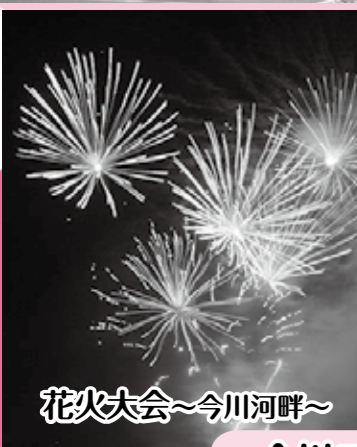
花火大会～今川河畔～