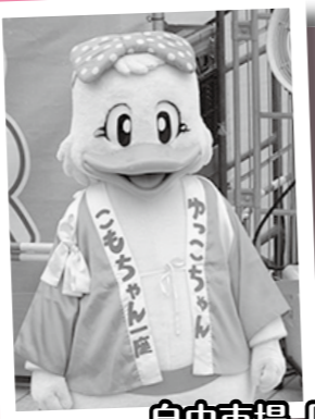
自由市場「いまいち」 ～今川河畔～