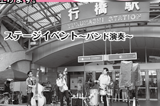
駅前ステージ～バンド演奏～