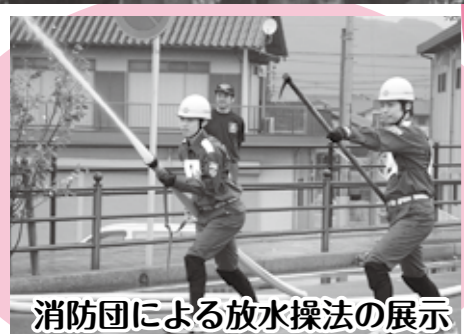
消防団による放水操法の展示