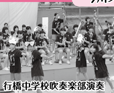
行橋中学校吹奏楽部演奏