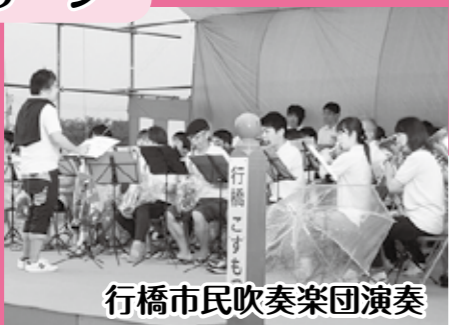
行橋市民吹奏楽団演奏