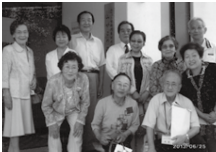
訪問先の老人ホームにて

新規会員募集 人の出会いと絆、健康増進を期待し、私達と一緒に各種ボランティアに参加してみませんか。 問合せ 行橋市社会福祉協議会 Tel 23・1111