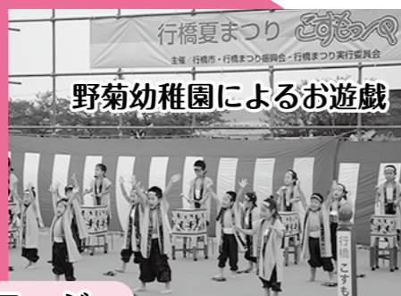
野菊幼稚園によるお遊戯