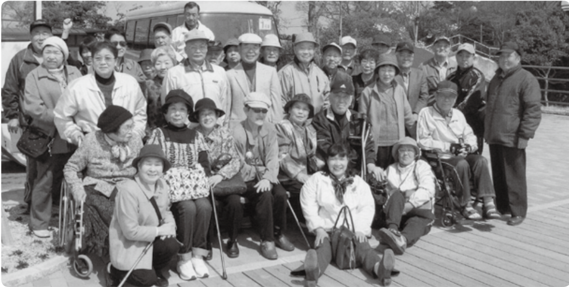
バス研修での集合写真。皆さん笑顔が素敵です。

こんにちは、介助ボランティアひまわりです。私たちは出会い、ふれ合い、助け合い、支え愛をテーマに活動を続け20年が経過しました。現在会員16人（男性9、女性7）が普段の活動や、毎月第1土曜日の朝10時からウイズゆくはし2階のボランティアルームで定例会を行い、会員の親睦を密にしています。