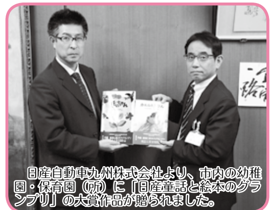
日産自動車九州株式会社より、市内の幼稚園・保育園 (所) に「日産童話と絵本のグランプリ」の大賞作品が贈られました。