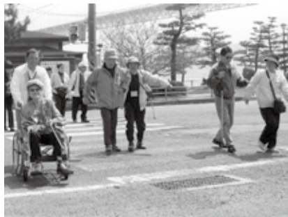
視覚障害者のガイド風景。周囲の安全に気を付けて介助します。

こんにちは、介助ボランティアひまわりです。私たちは出会い、ふれ合い、助け合い、支え愛をテーマに活動を続け20年が経過しました。現在会員16人（男性9、女性7）が普段の活動や、毎月第1土曜日の朝10時からウイズゆくはし2階のボランティアルームで定例会を行い、会員の親睦を密にしています。