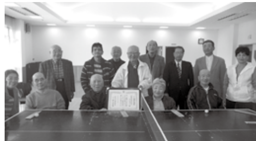
10月に地域ケア複合センターで行われた「小さな親切」実行章の伝達式。

主な活動は行橋市介護保険課が行っている「あそびり村」利用者（身体に障害を持たれている方）のバス送迎介助、卓球バレー、パソコン、カラオケ、将棋、オセロなど各教室 indoor の介助です。また、行