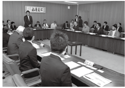
▲第1回策定委員会の様子

◆第1回 平成29年10月の第1回会議では、構想内容について異論等はなかったものの、次のような議論が交わされました。 ◆広域での連携を視野に入れながらの開発が重要で、将来の世代が、行橋市に住んでよかったと思えるようにすべき ◆行橋市の将来について考えながら具体化していくことになるが、実現させるといふことだけではなく、持続性があるものでなければならぬ ◆全国的な先行事例であれば、後悔しないよう、ランクアップした構想とし、今川PAが目的地の一つとなるような計画を目指すべき