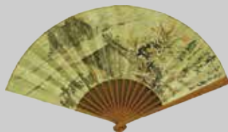
▲富岡鉄斎 「扇 田家早梅図」