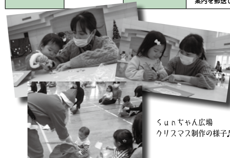
Sunちゃん広場 クリスマス制作の様子♪