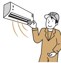
給湯器やエアコンといった設備を省エネ用の高性能なものに交換

省エネ設備の交換や建物自体の冷暖房効果を高めることで、必要なエネルギー消費を抑えることが可能です。断熱性能が高く、暖かい『省エネ住宅』は、住まい手の健康づくりにもつながります。