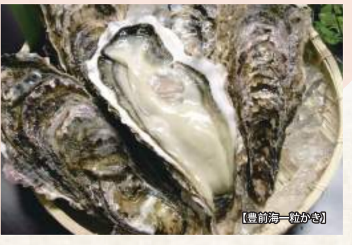
[DATA] 行橋市魚市場・海鮮館

[DATA] 永田カキ直売所 行橋市大字養島470-5 ☎ 0930-24-1296 営業時間: 9:00~17:00