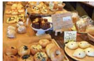
あたたかい雰囲気、誰もが立ち寄れる安心感あふれる店内。