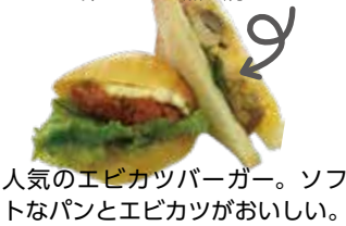
人気のエビカツバーガー。ソフトなパンとエビカツがおいしい。