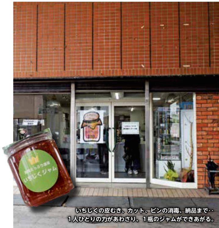
いちじくの皮むき、カット、ピンの消毒、納品まで…1人ひとりの力があわさり、1瓶のジャムができあがる。