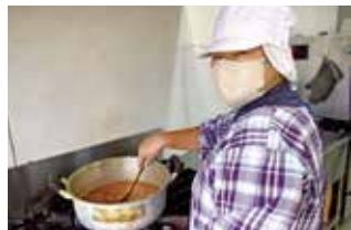
焦げないように、かたまらないように…ジャム練りが得意な利用者さん。