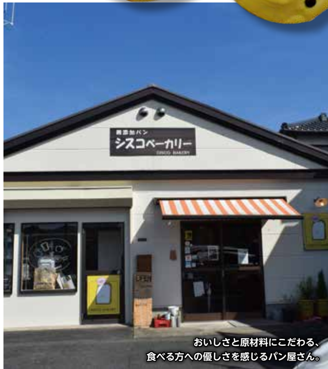
おいさと原材料にこだわる、食べる方への優しさを感じるパン屋さん。