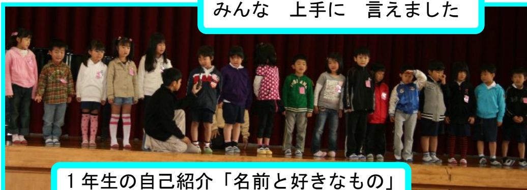
1年生の自己紹介「名前と好きなもの」