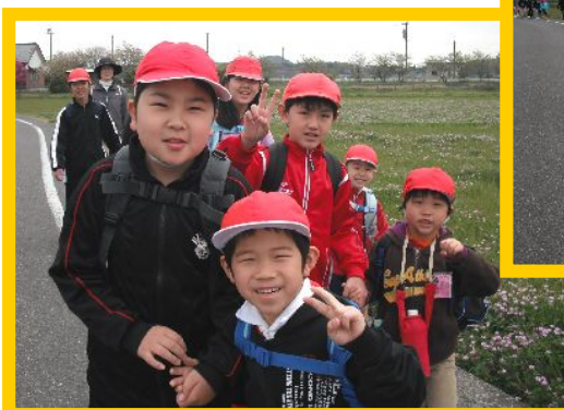
6年生のお兄さん・お姉さんに手を引かれて「御所ヶ谷」へ