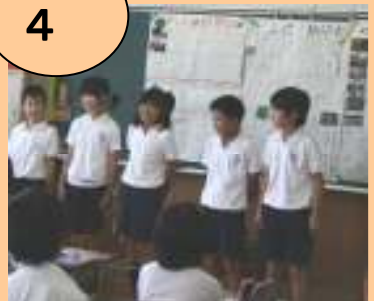
総合的な学習の時間 ～探検ジャパン～ 稗田小のよさを見つけ