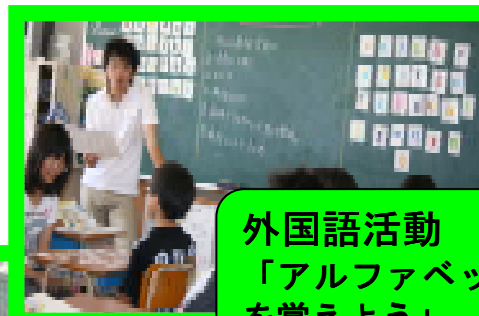
外国語活動 「アルファベット を覚えよう」