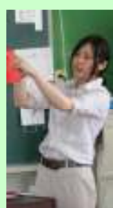
家庭科 「玉止めを使ってマスコットを作ろう！」