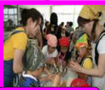
親子ふれあい 「パフェづくり」