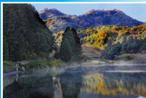
市長賞「晩秋の馬ヶ岳」