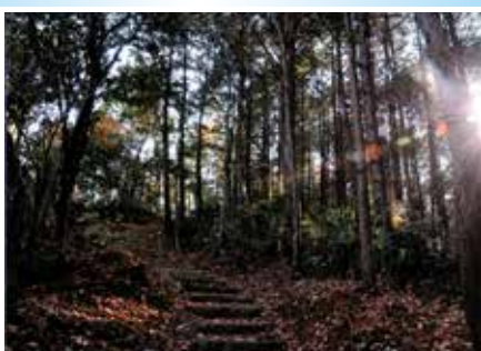
教育長賞「官兵衛さんの歩いた道」