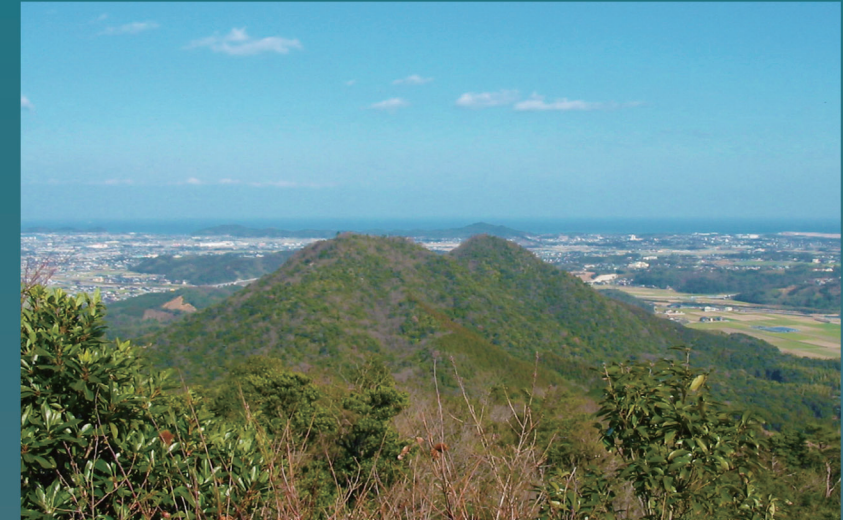
西の御所ヶ岳から馬ヶ岳を望む