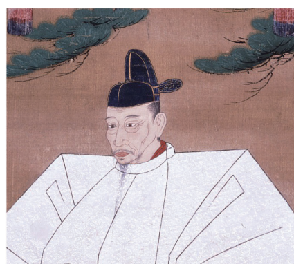
● 豊臣秀吉 (1537 ~ 1598)