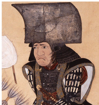
● 黒田長政 (1568～1623)