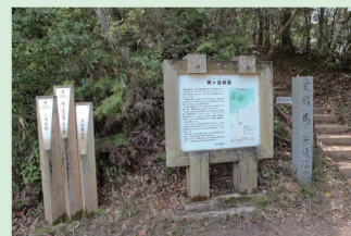
大谷登山口看板(右が登山道)