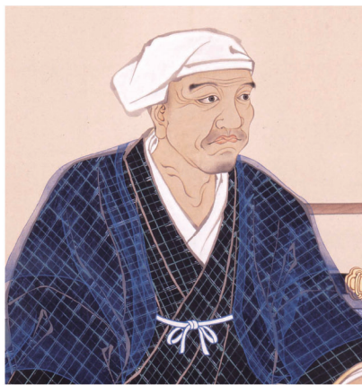
● 黒田官兵衛(如水)(1546～1604)

領地南部が安定した頃、黒田氏は山地の馬ヶ岳城から海に面した平地の中津城へ拠点を移しました。居城が中津城となった後も、馬ヶ岳城は支城として黒田氏の領内統治を支えました。