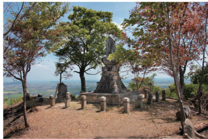
● 馬ヶ岳城の本丸跡に立つ新田氏の表忠碑