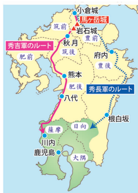
● 豊臣秀吉の九州平定ルート