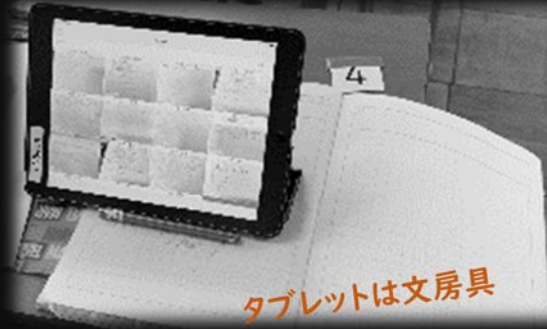
タブレットは文房具