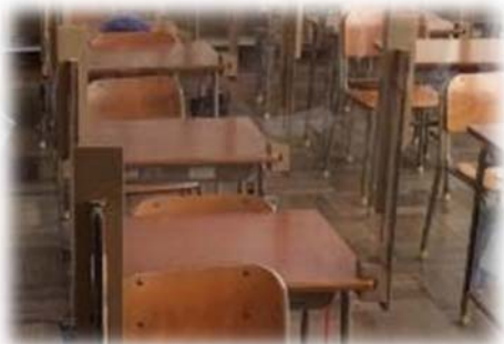
全校に飛沫防止シールド配備 (6月議会承認)