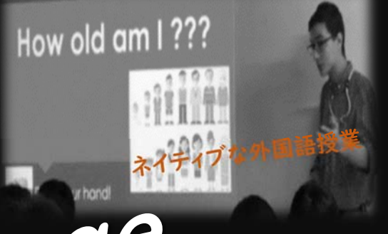
ネイティブな外国語授業