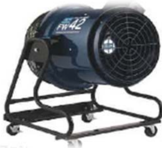
全校体育館に大型送風機を完備 (7月議会承認)