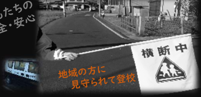
地域の方に 見守られて登校