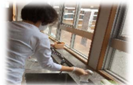
消毒等業務サポートスタッフを 学校に9名配置 (7月議会承認)