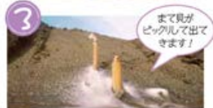
3 まて貝が ピクッとして出て きます！