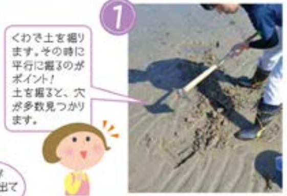
1 くわで土を掘ります。その時に 平行に掘るのがポイント！ 土を掘ると、穴が多数見つかります。