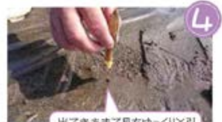
4 出てきたまて貝をゆっくりと引き抜きます。その時に斜めから土ごと引き抜くのがポイント！