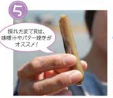
5 採れたまて貝は、 味噌汁やバター焼きが オススメ！