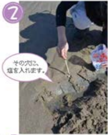
2 その穴に、 ほりを入れます。