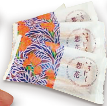
いちじく想花 Ichijiku Souka (baked sweet flavored with fig jam)