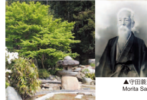
▲守田蓑洲 Morita Sashu