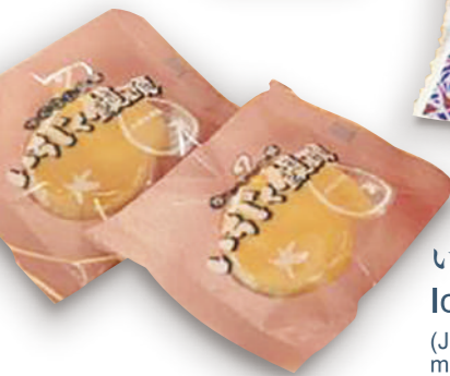
いちじく饅頭 Ichijiku Manju (Japanese cake with fillings made of fig)