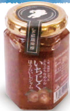
いちじくジャム Fig jam

Specialties: In Yukuhashi City, souvenirs which use farm products are popular. Snacks and jam using figs are especially recommended.