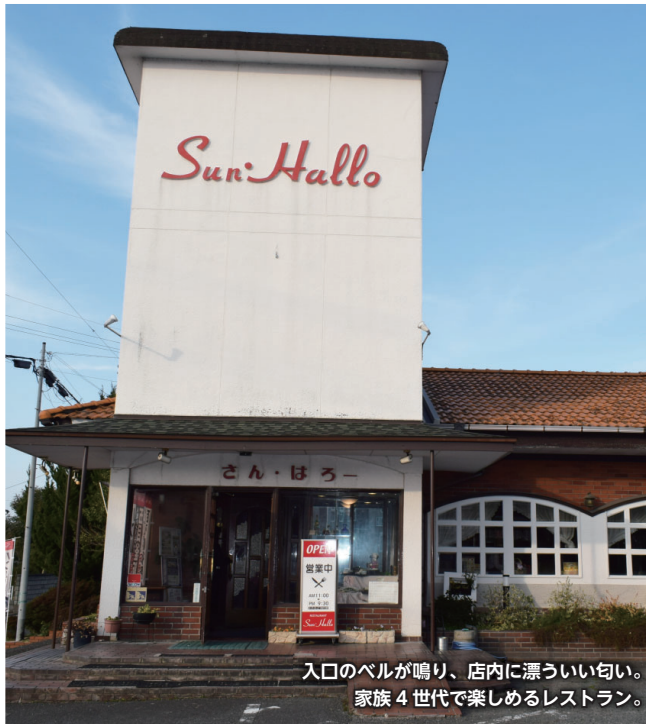
入口のベルが鳴り、店内に漂ういい匂い。家族4世代で楽しめるレストラン。