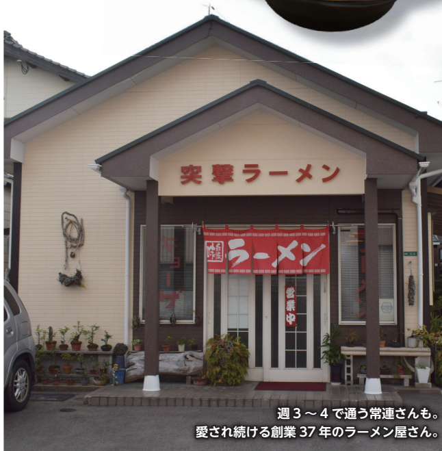
週3~4で通う常連さんも。愛され続ける創業37年のラーメン屋さん。