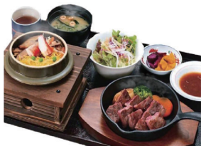
「五目釜飯とサイコロステーキ」は不動の人気No1! ボリューム満点です。

国道10号線沿い、辻垣にあるレストラン。昭和55年に創業し、今も変わらず愛され続けており、老若男女楽しめる豊富なメニューと手作り料理が味わえる魅力があります。期間限定メニューや割引メニューなど心をつかまれるイベントも定期的にあります。また、創業当時からのこだわりの味付けを今も味わうことができます。店内には広い座敷もあるため、親戚の集まりなど大人数でも利用できます。