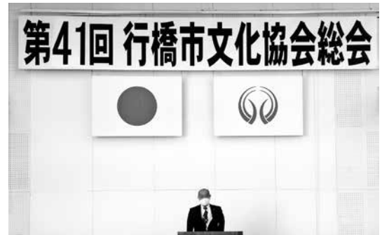
4/17 行橋市文化協会総会