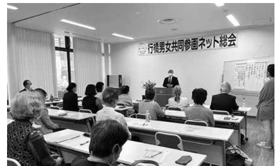
4/22 行橋男女共同参画ネット総会