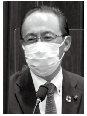
やの じゅんいち 潤一 議員 矢野 潤一 議員