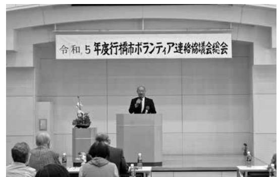
4/23 行橋市ボランティア連絡協議会通常総会