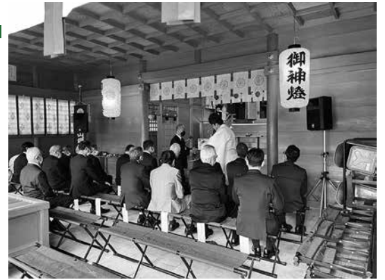
4/15 行橋京都地区戦没者合同慰霊祭