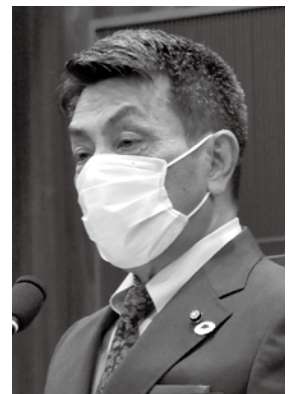
にしおか じゅんすけ 西岡 淳輔 議員