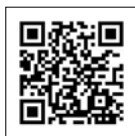
行橋市議会ホームページ