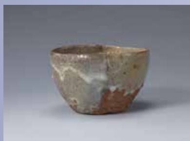
《片身替り茶碗 銘「天地」》