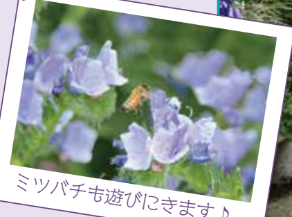
ミツバチも遊びにきます♪