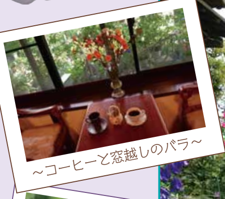
~コーヒーと窓越しのバラ~