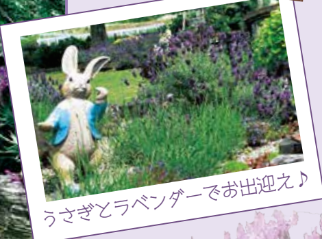
うさぎとラベンダーでお出迎え♪