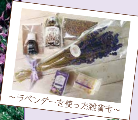
~ラベンダーを使った雑貨も~

5月に行われたフラワーイベント!!コロナ禍で外出できなかった方に、華やかな風景をご紹介します🐾 ※いずれも十分な感染対策を行った上で開催されました♪