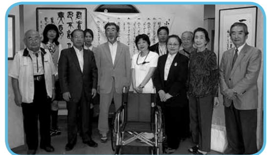
「小さな親切」運動行橋支部より京都医師会在宅医療・介護連携支援センターに車いすが寄贈されました。

■昨年行われた国勢調査の確定値が発表されました。福岡県で人口が減少する自治体が 44 市町村に上る中、行橋市は緩やかながらも、増加が続いています。そして個人的に嬉しいのが「県内の主な自治体」として報道されたこと☆定住促進や企業誘致など自治体間の競争が活発になっていますが、中でも注目されるのが「ふるさと納税」の取り組み。表紙で取り上げたように、市では事業者の方々のご理解をいただき返礼品の数を大幅に増やしました☆加齢が懸念される声があるものの、行橋を理解してもらうきっかけとなるのも事実。昨年度は約 4.3 倍と大幅にアップしています。定住人口に加えて市外からの交流人口も増加させるため、ぜひご協力ください。(高)