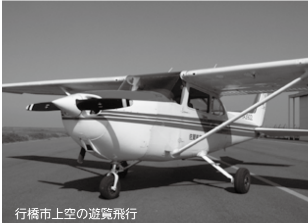
行橋市上空の遊覧飛行