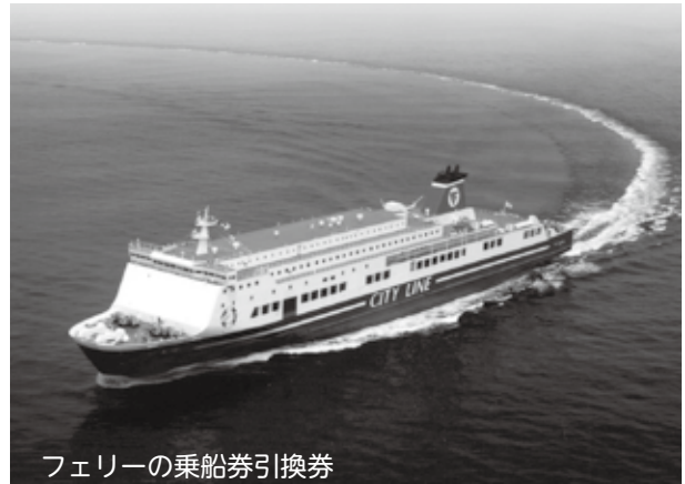
フェリーの乗船券引換券

ふるさと納税とは地方の人口減、高齢化という問題を背景に、就職や転職により都市に住む人たちの税の一部を「生まれ育ったふるさと」に還元するシステムです。頂いた寄付金は行橋市の貴重な財源として、様々な事業に活用させていただきます。