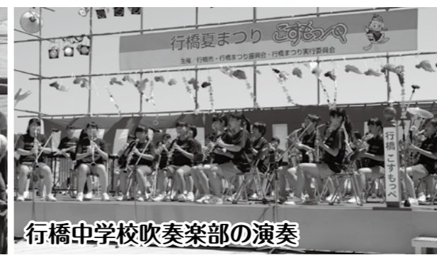
行橋中学校吹奏楽部の演奏