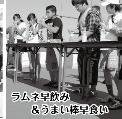
ラムネ早飲み & うまい棒早食い