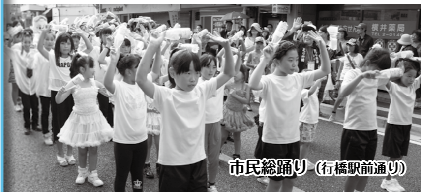
市民総踊り(行橋駅前通り)