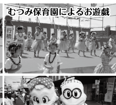
むつみ保育園によるお遊戯