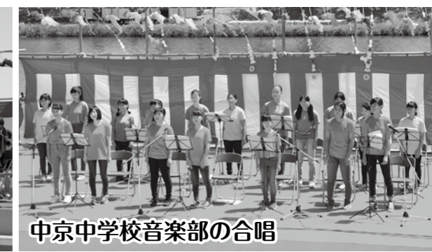
中京中学校音楽部の合唱