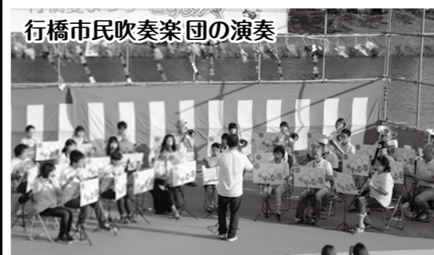
行橋市民吹奏楽団の演奏