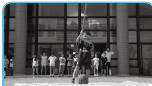
夏休み期間中、市社会福祉協議会の学童保育めだかの学級が開催され、恒例の宿泊研修では子どもたちがスイカ割り体験しました。