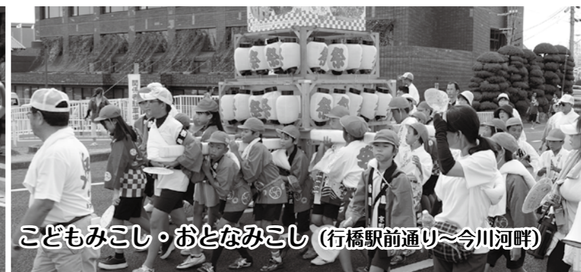
こどもみこし・おとなみこし(行橋駅前通り～今川河畔)