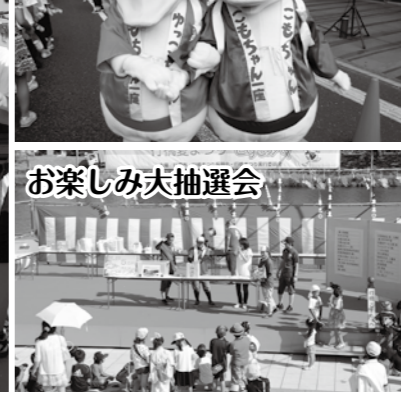
お楽しみ大抽選会