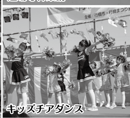
キッズチアダンス