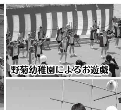
野菊幼稚園によるお遊戯