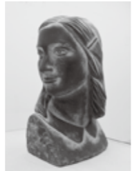
▲アンネ・フランク