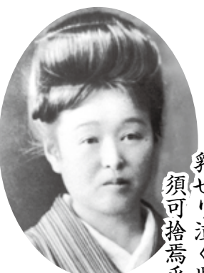
短夜や 乳せり泣く児を 須可捨焉乎

近 代女流俳句史において、その黎明期に多大な功績を残した行橋市小川出身の竹下しづの女を顕彰し、地域俳句文化の興隆を図ることを目的として、標記俳句大会を開催します。皆さまの応募・ご参加をお待ちしています。 ◇ 俳句大会 ◇ 日時 7月10日(日) 9時から受付 ◇ 場所 行橋市中央公民館 1階大会議室 ◇ 当日句 2句(当季雑詠) 投句締切11時 ◇ 作品の募集(ジャンル) ◇ 投句 2句1組(当季雑詠・未発表作品に限る) ◇ 投句方法 俳句(楷書で明確に)、住所、氏名、電話番号を明記のうえ、ご応募ください。投句用紙は自由です。また、1人何組でも応募可能です。 ◇ 投句料 1組につき1000円 ◇ 締切 5月31日(火) ※当日消印有効 ◇ 選者 寺井谷子(自鳴鐘主宰) 福本弘明(天籟通信主宰) 尾崎隆則(菜殻火同人、椎の美同人) 松清ともこ(青嶺同人) ◇ 応募先 竹下しづの女俳句顕彰会 吉村 良男 〒824-0061 行橋市草野7-4