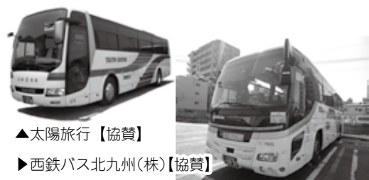
▲太陽旅行【協賛】 ▶西鉄バス北九州(株)【協賛】

九州自動車道 椎田南IC～豊前ICの開通が4月24日に決まりました。これを記念して、東九州自動車道の京築地域における全線開通をお知らせするとともに、ご協力いただいた地域住民の皆さまに感謝の気持ちをこめて、開通記念イベントを実施します。