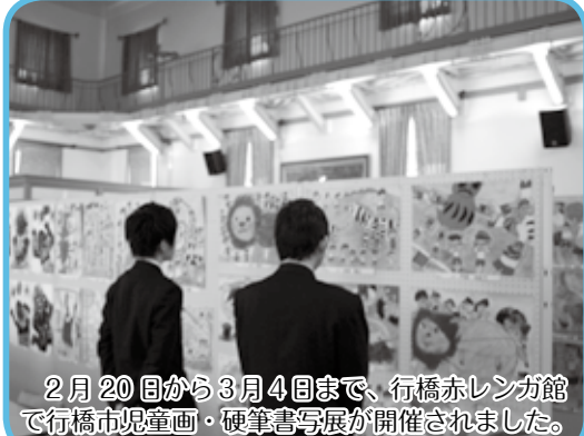
2 月 20 日から 3 月 4 日まで、行橋赤レンガ館で「行橋市児童画・硬筆書写展」が開催されました。