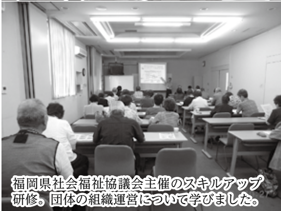
福岡県社会福祉協議会主催のスキルアップ研修。団体の組織運営について学びました。