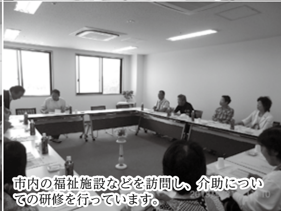
市内の福祉施設などを訪問し、介助についての研修を行っています。