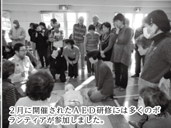
2月に開催されたAED研修には多くのボランティアが参加しました。