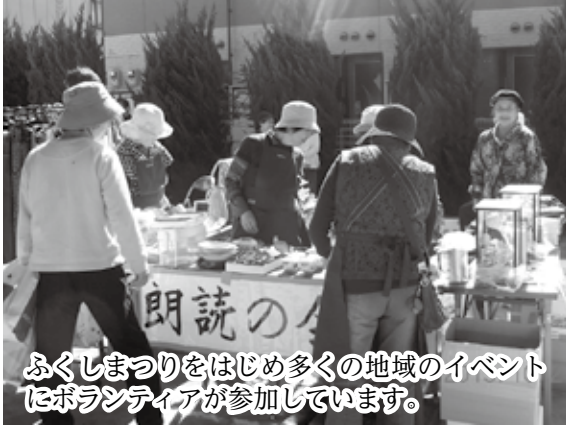
ふくしまつりをはじめ多くの地域のイベントにボランティアが参加しています。