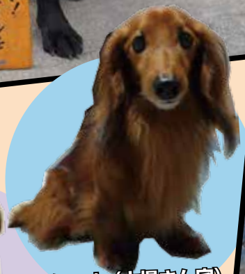
シュウ (大場さん宅)