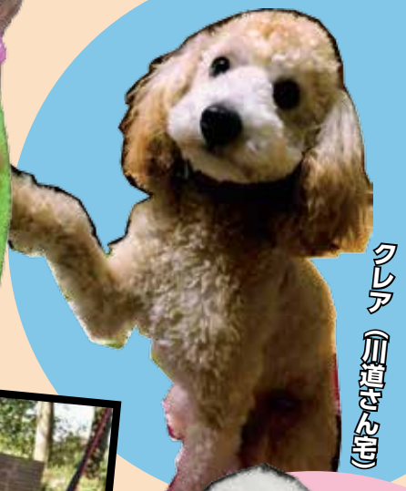
クレア (川道さん宅)