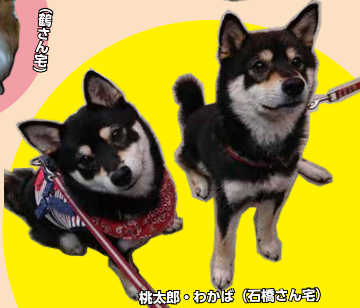
桃太郎・わかば (石橋さん宅)