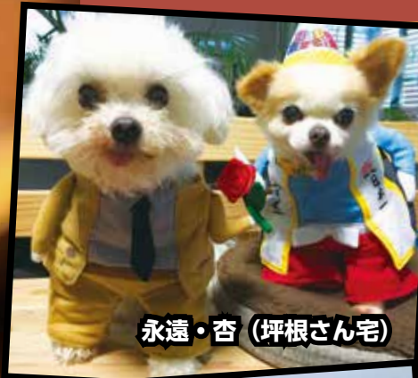
永遠・杏 (坪根さん宅)