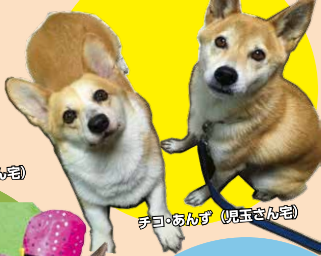
チコ・あんず (児玉さん宅)