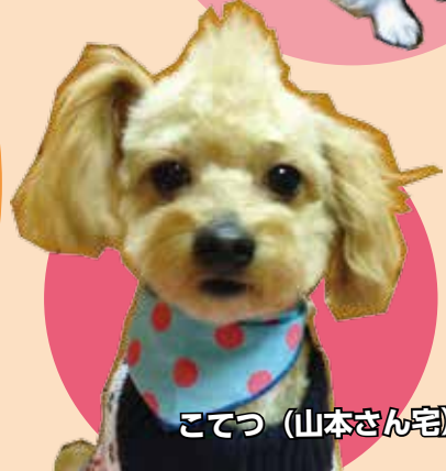
こてつ (山本さん宅)