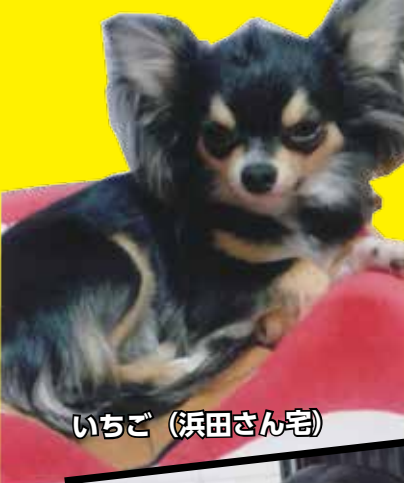
いちご (浜田さん宅)