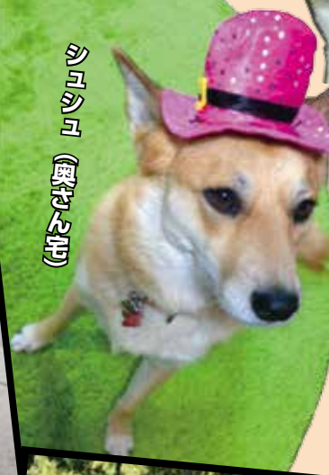
シロシロ (奥野さん宅)