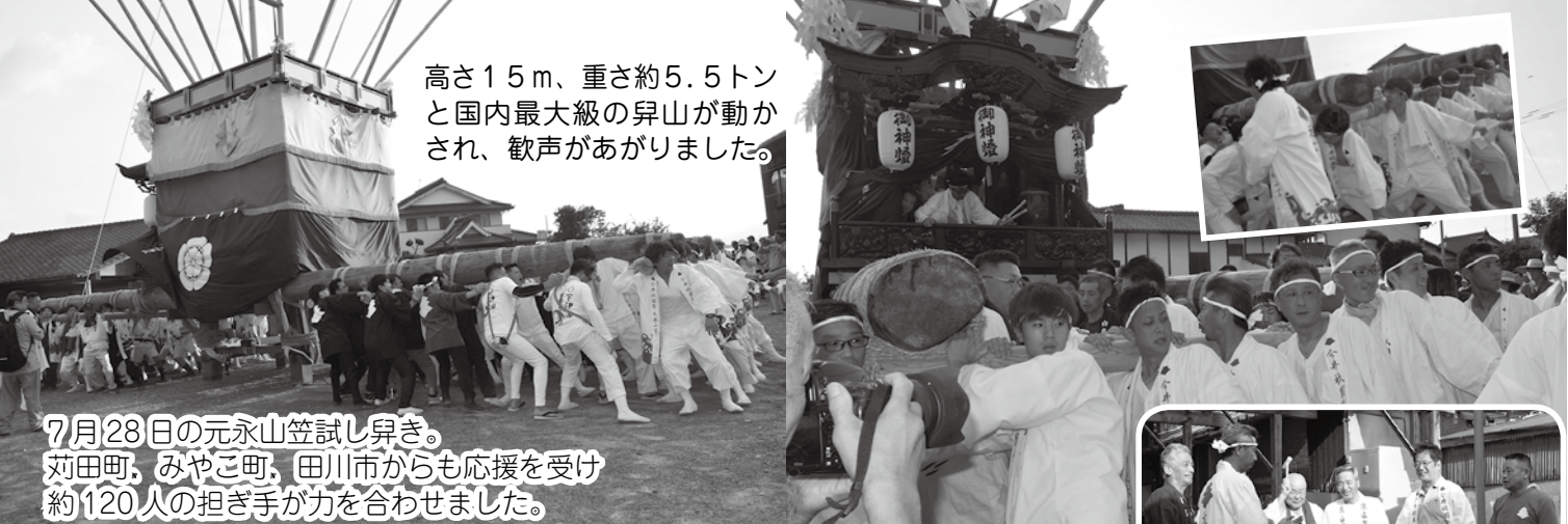
高さ15m、重さ約5.5トンと国内最大級の昇山が動かされ、歓声があがりました。