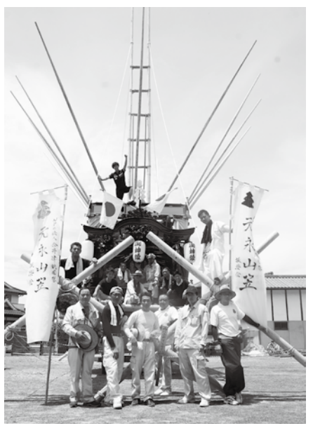
元永山笠の昇山 (7月22日飾り付けの様子)

山は曳山(車輪付きのひき動かす山)と昇山(車輪のない担ぎ上げて動かす山)の2種類。かつては6基ありましたが、現在は今井西町の曳山のみ。そして今年77年ぶりに元永の昇山が復元され、試し昇きが行われました。これは地元住民らでつくられたNPO法人「今井津祇園祭 元永山笠振興会」が地域活性化につなげようと11年前からの取り組みであり、今後の完全復活に向けた大きな一歩となりました。来年もさらに楽しみです。