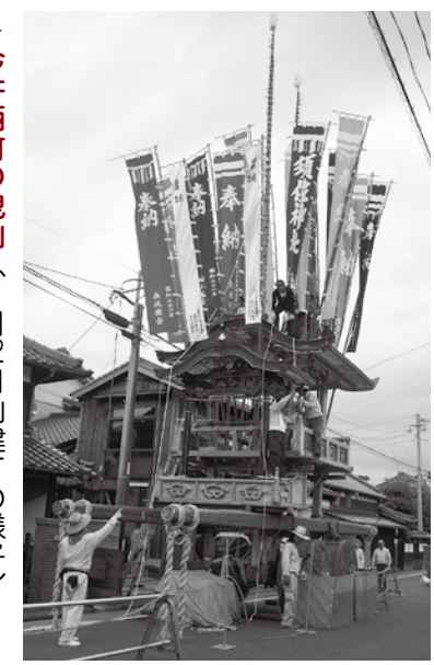
今井西町の曳山 (7月22日山建ての様子)

福岡県指定無形民俗文化財「今井祇園行事」。「連歌」、「山」の各行事から成り、天下泰平・五穀豊穡・無病息災・厄除開運を祈願して、今井津須佐神社(今井の祇園さん)に奉納される、夏の祭礼行事です。