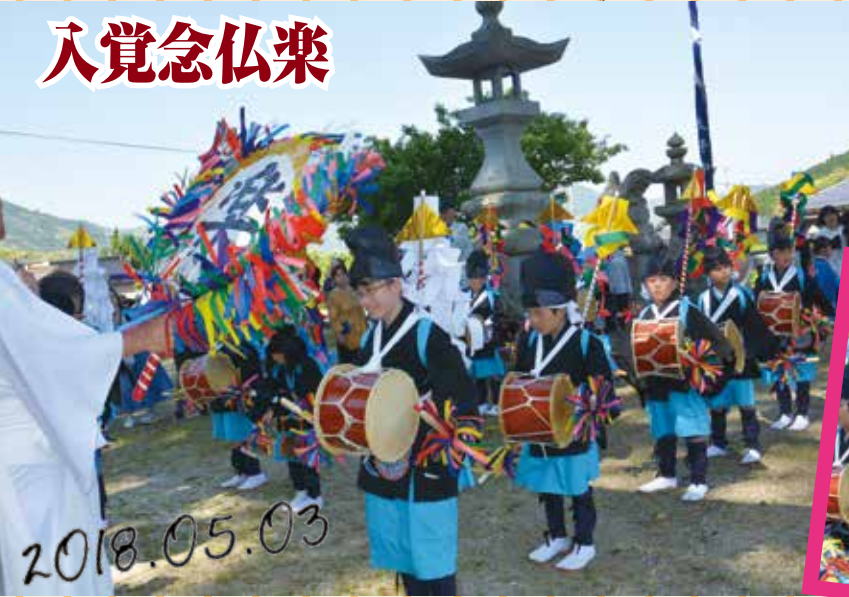
行橋市指定無形民俗文化財