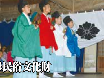
国指定重要無形民俗文化財