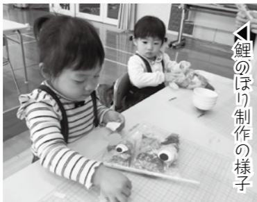
鯉のぼり制作の様子

年齢別に毎月、運動や製作などをして遊びます。お母さん方の交流の場としてもご利用ください。