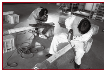
▲電動ドリルでいろいろな大きさの穴を開けていきます!