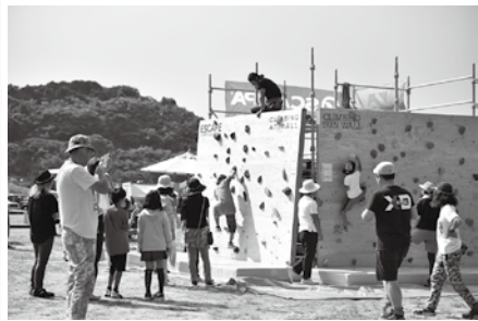
▲会場には、ボルダリング体験ができるスペースも設置予定です。行橋がカリフォルニアになる一日です！

カリフォルニア リフォルニアの雰囲気を感じることができる「カリフォルニア・デイ」を行橋で初めて開催します！ 当日は、創作ハンバーガー店の出店をはじめ、フリーマーケット、ステージライブ、ハレーやアメ車の展示など、イベントを多数用意しています。音楽を聞きながら、楽しい時間を過ごしませんか。 ◇日時 3月21日(水・祝) 9時～17時 ※雨天決行 ◇場所 行橋総合公園 ◇入場料 一般500円 高校生以下は無料