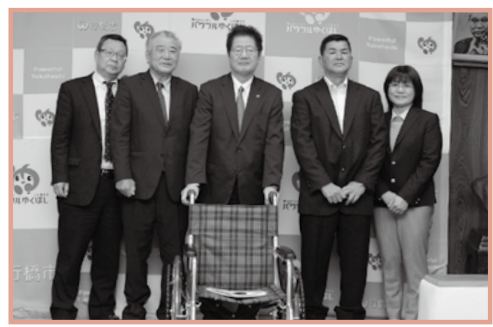
3月8日、行橋高校同窓会「明豊会」より車いす2台を行橋市へ寄贈いただきました。

前まで来ているようです。(い) ■公開で石の彫刻を制作する「まちなかオブジェ・プロジェクト」が今年も開催されました。世界で活躍する6人の彫刻家は、工具等を駆使しながら、市内各所に飾る作品を制作。大きな石を彫る作業は想像以上に繊細で緻密な作業だと感じましたが、制作の過程を間近に見られるのは貴重な機会でした。また彫刻家と見学者たちが触れ合い、笑顔があふれる場面も。中でも小学生が身振り手振りを交えて、外国の彫刻家とコミュニケーションを図ろうとする姿は微笑ましく感じました。プロジェクトの詳しい内容は次号にてお届け予定です。☆雪が多く寒かった冬も終わりに近づき、暖かい陽射しを楽しめるようになりました。春の訪れは目の