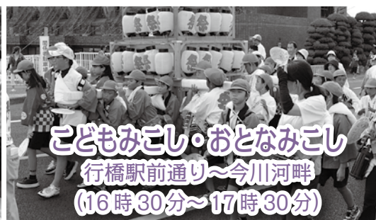
こどもみこし・おとなみこし 行橋駅前通り～今川河畔 (16時30分～17時30分)