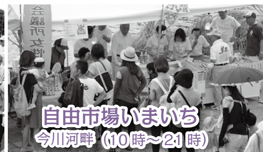
自由市場いまいち 今川河畔 (10時～21時)