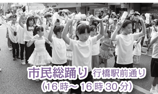
市民総踊り 行橋駅前通り (16時～16時30分)

【お問合せ】 市商業観光課内 まつり事務局 Tel 25-1111 (内線 1222)