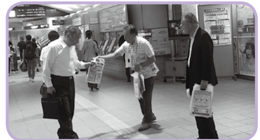
7 月 19 日、JR 行橋駅で行橋市と行橋市防犯組合連合会による街頭啓発活動が行われ、駅利用者に関係者がチラシや啓発用品を手渡しながら、安全安心なまちづくりを呼びかけました。

■前々号のスポーツ欄にカタカナの見慣れない名前が。しかも、所属は市役所バドミントンクラブ。確認すると、市内企業のベトナム人従業員さんでした。宿舎の近くで練習している市役所のチームに声をかけ、今では市職員とともに汗を流しているそうです☆思えば、初の国際交流員としてカスミ・ヤマシタさんが行橋に着任したのが平成 4 年の今頃。それから四半世紀、様々な形で地域レベルの国際交流が取り組まれて来ましたが、今改めて振り返ると、耳にしたのは、こんな会話。「遠い国から来るとるんやね。行橋の夏は暑いけ、気をつけんと」「ハイ、ありがと。ごさいます！」二人とも夏祭の帰り道のように。屈託のないやりとり。25 年の歳月を感じました。(高)