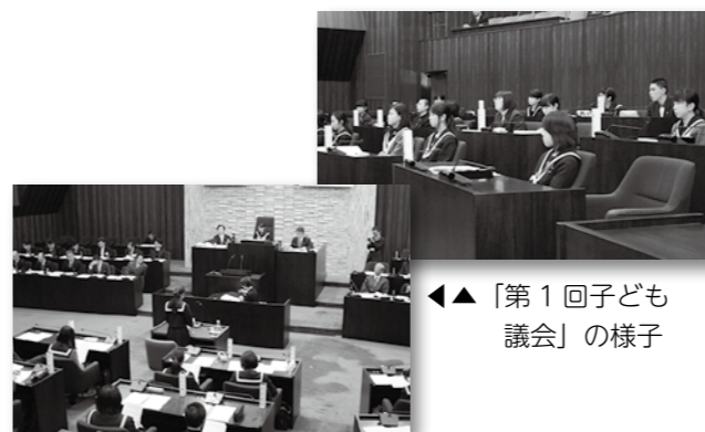
◀「第1回子ども議会」の様子

平 成27年に選挙権年齢が18歳以上に引き下げられたことに伴い、行政や議会のしくみを学び、市政・議会活動への関心を高める機会の一環として、「行橋市子ども議会」を平成28年2月に開催しました。 行橋市では初めてとなった子ども議会では、市内の各中学校から選ばれた生徒18人が、日常生活の中で感じた疑問や、市をより良くするための意見などについて、質問・提案を行いました。参加した子ども議員や傍聴者から大変好評をいただきましたので、第2回目となる子ども議会を開催します。