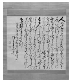
▲高橋泥舟「東照公遺訓」

行橋市増田美術館では、6月4日(日)まで、高杉晋作や福澤諭吉など美術館所蔵の近世・近代の著名人の書や画賛が添えられた作品を展示しています。さまざまな書との出会いをお楽しみください(入場料:一般500円)。