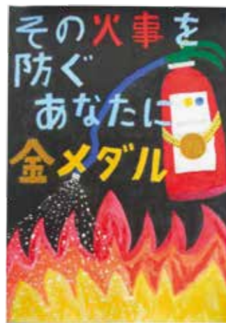
泉小6年 永留 綾