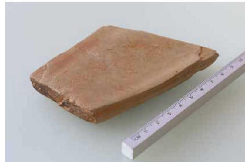
硯と見られる出土品は、瓦や塀の材料となる粘板岩(スレート)製。これまで石包丁などを磨く砥石だと考えられていました。