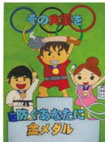
稗田小5年 大本 みゆ