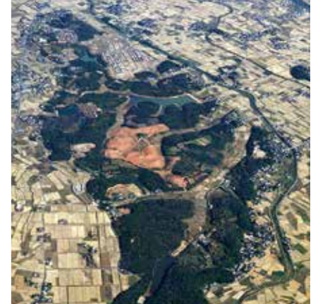
写真の中央部分が発掘調査当時の下稗田遺跡。大規模な集落跡で現在の宮の杜周辺にあたります。