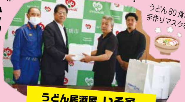
うどん居酒屋 いそ家