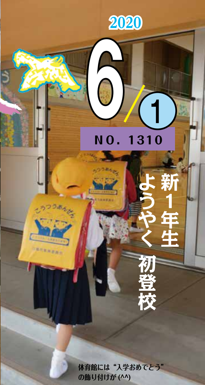
体育館には“入学おめでとう”の飾り付けが(^^)

5月21日、分散登校のかたちで市内の小中学校が再開されました。このうち、小学校で新1年生を迎えたのは693人。今年は新型コロナウイルスの影響のため、ランドセルを背負って学校に来るのも、先生に会うのもこの日が初めて。そのせいか、元気いっぱい初登校！というよりは、中には不安な面持ちの児童の姿も。一方、他の学年では「なんか大きくなったね~!(^^)」「マスクで顔が分からん(^^)」などと、久しぶりに子どもたちの元気な姿を見る先生方の嬉しそうなお姿も印象的でした。