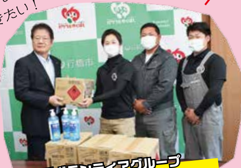
若手ボランティアグループ ゆくはしどうしよう会