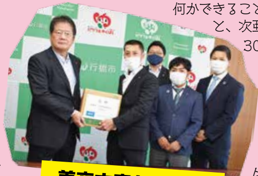
美夜古青年会議所