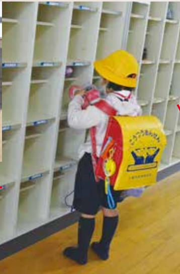
上靴上手に履けるかな~