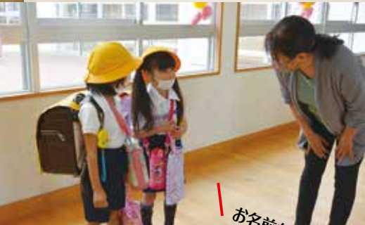
お名前なんですか