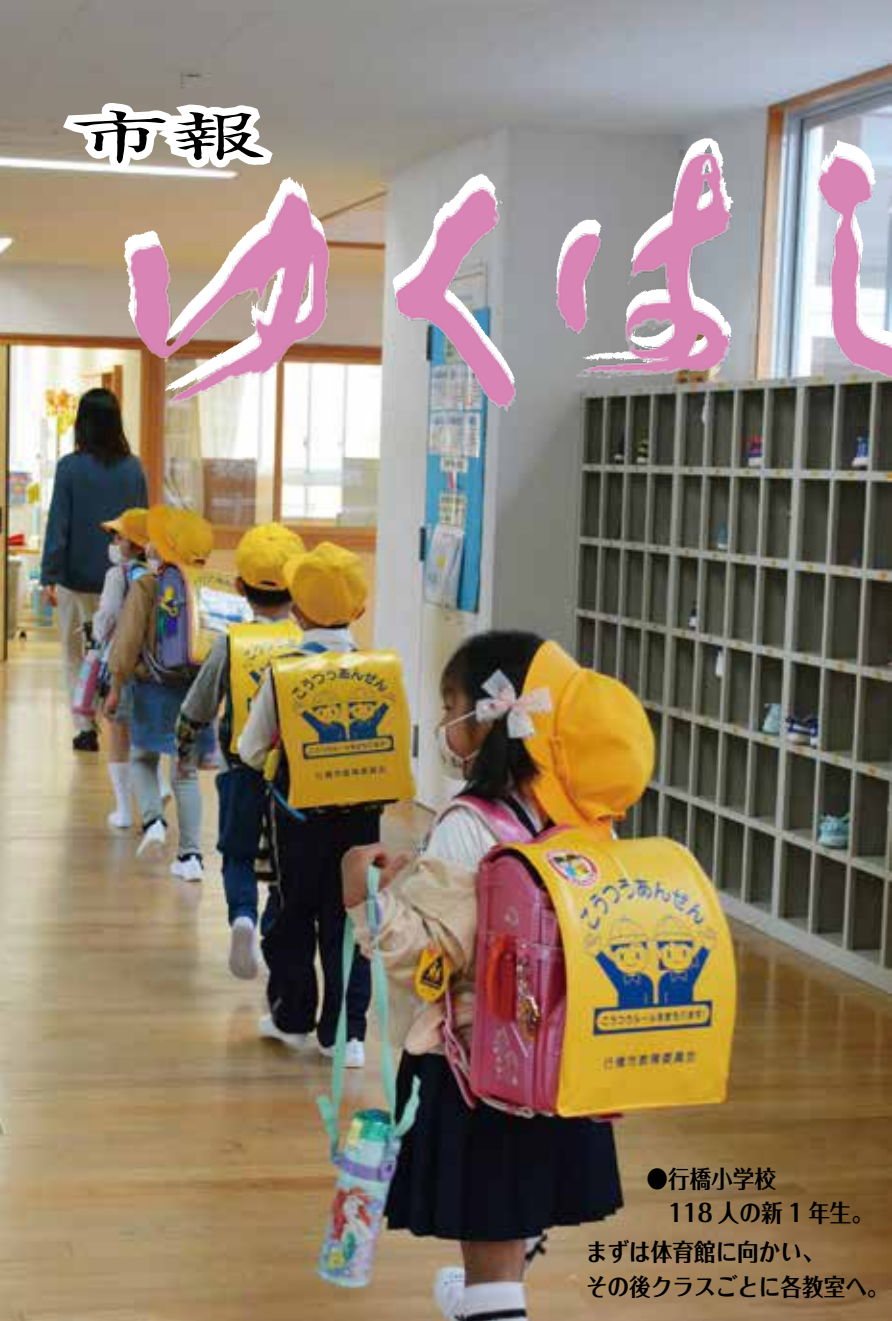
●行橋小学校 118人の新1年生。