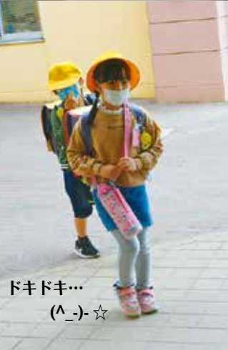
ドキドキ... (^_^) ☆