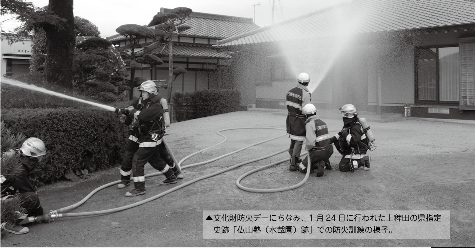
▲文化財防火デーにちなみ、1月24日に行われた上稗田の県指定史跡「仏山塾(水哉園)跡」での防火訓練の様子。

◆ 戦傷病者は、 ①両下肢、体幹障害が特別、第一、第二各項症の方 ②心臓、じん臓、ぼうこうまたは呼吸器、直腸、小腸および肝臓の障害が特別、第一～第三各項症の方。 ◆ 要介護者は、 被保険者証の要介護状態区分が要介護5である方。 ★郵便投票は郵便投票証明書がないと、投票できません。この証明書の交付は日数がかかりますので、早めに市選挙管理委員会に手帳を添えて申請してください。 すでに同証明書の交付を受けている方は、4月8日(水)17時までに市選挙管理委員会に投票用紙を請求してください(選挙の公示または告示が行われる前でも請求できます)。