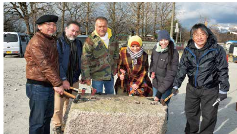
初日の石割式に参加した彫刻家ら（左）。公開で行われた制作の様子（右）。市内のギャラリーでは過去に発表した作品を展示（下）。