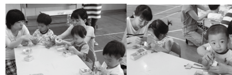
▲スマイルキッズルームでの様子